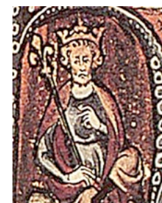
Knud den store