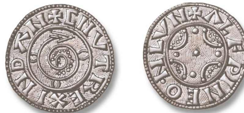
Mynt ur den Danska serien, präglad av Knud den store.

Knud den store (1014-1035) fortsatte prägla silverpenningar med kungabild på framsidan och kunganamnet, titeln "CNVT REX DENORVM", med större eller mindre kors på baksidan. Ibland stod myntslagningsorten angiven, exempelvis Roskilde, och mynt-