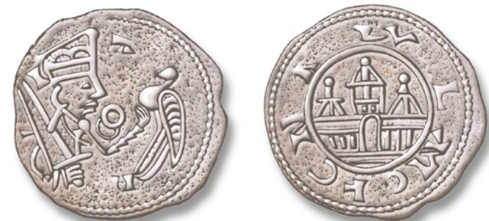
Niels (1104-1134) eller "NICOLAVS" som det står på myntet, hade förutom kungabilder även byggnader på sina mynt.