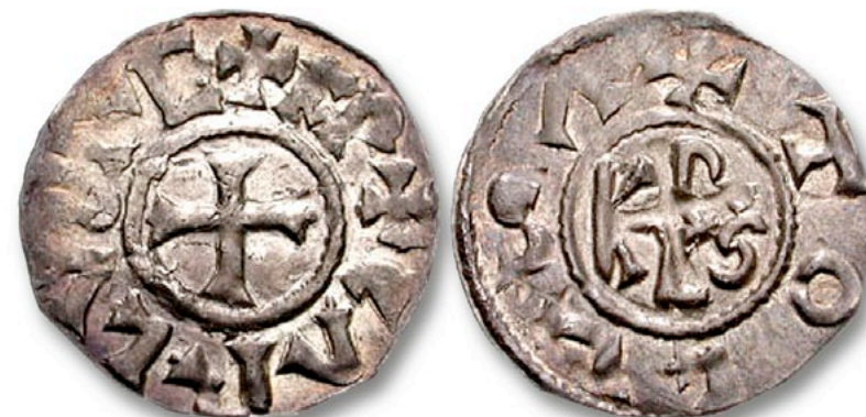
Karl den stores denarer från Dorestad

De första kända skandinaviska mynten präglades i Hedeby som kopior eller förfälskningar av utländska mynt, ofta Karl den stores denarer från Dorestad på 800-talet. Då de skandinaviska myntpräglarna inte förstod myntens inskrift kunde det till exempel