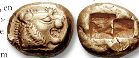
Early 6th century BC one-third stater coin.