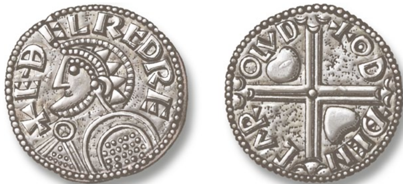
Hardeknud mynt med Æthelred II's namn.

Magnus och Hardeknud kom emellertid överens, och beslutade att den längstlevade av dem skulle ärvta tronen i både Danmark och Norge. Hardeknud dog först, han blev bara 23 eller 24 år. Krönikan skriver om honom, att "i hele sin kongetid udrettede han intet der var en konge værdigt".