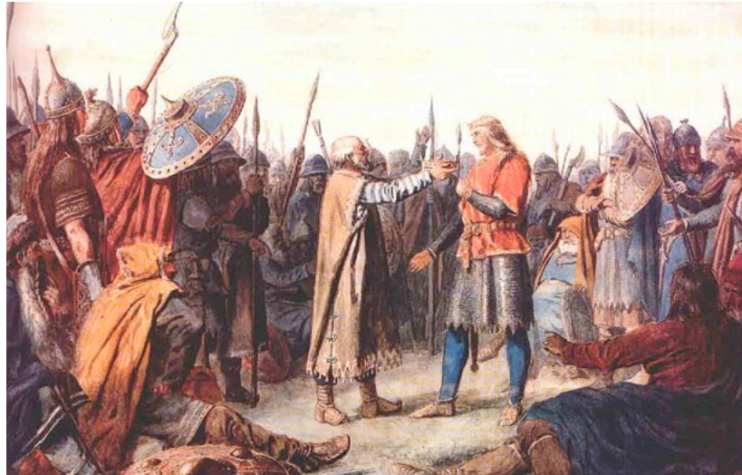
Olav Trygvasons kröning av Peter Nicolai Arbo.