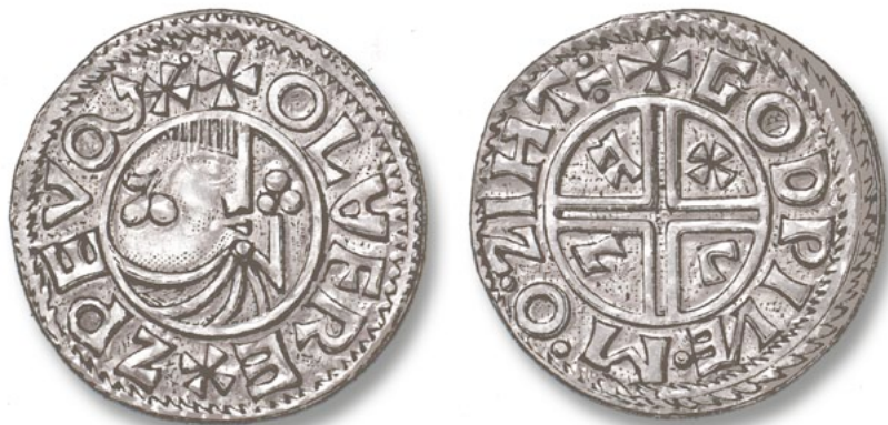
Silvermynt slaget för Olof Skötkonung

I Sverige präglade Olof Skötkonung (995-1022) mynt från 995, av