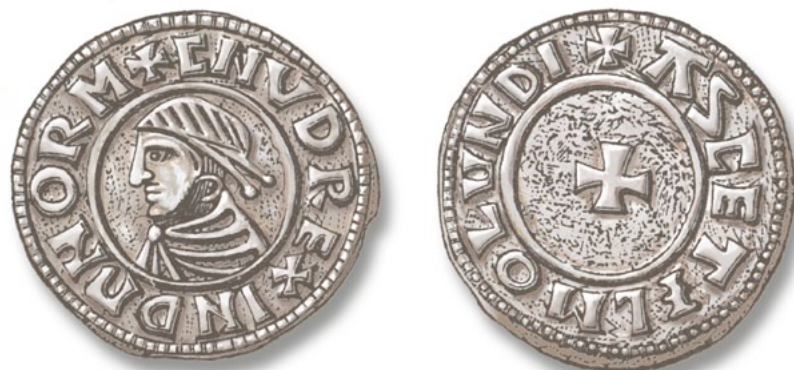
Mynt ur den skånska serien, präglad av Knud den store.

Hardeknud (1035-1042) lät prägla de flesta mynt i samma stil som Knud. Undantag var ett Lundamynt inspirerat av mynt från bysantinska kejsarna Basilius II och Konstantin VIII, med två bröstbilder med en fot mellan sig på framsidan.