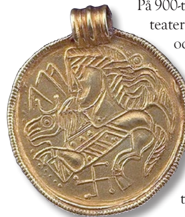
Smyckesbrakteat som antas föreställa Oden.

Ingen av ovannämnda mynt tros ha haft betydelse som betalningsmedel, andelen skandinaviska mynt i vikingatida myntfynd från 800-900-talen är mycket få.