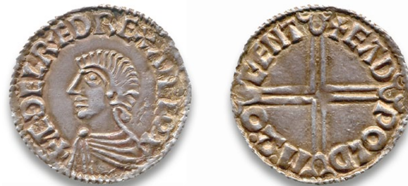
"Långkors" mynt av Æthelred II, präglad i Eadwold, Canterbury, ca. 997-1003

Notera att man kunde dela mynten lättare i Halfpenny och fathing (1/4 penny) genom ettpräglat kors på myntets baksida.