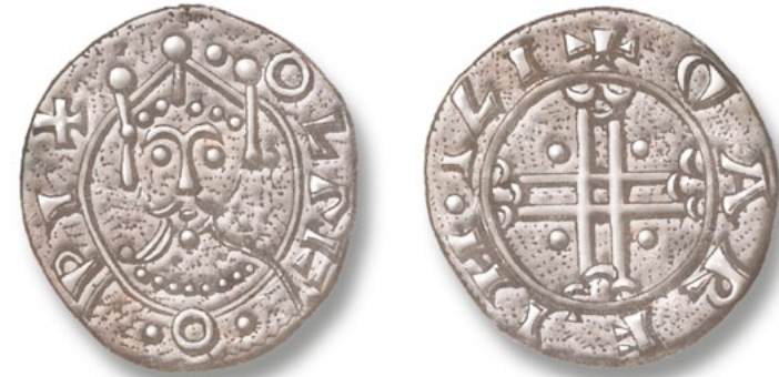
Oluf Hungers (1086-1095) mynt påminde om Knuds mynt.