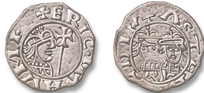
Erik Ejegods (1095-1103) mest kända mynt visar en krönt kung med draget svärd. Två Lundamynttyper visar två krönte män.