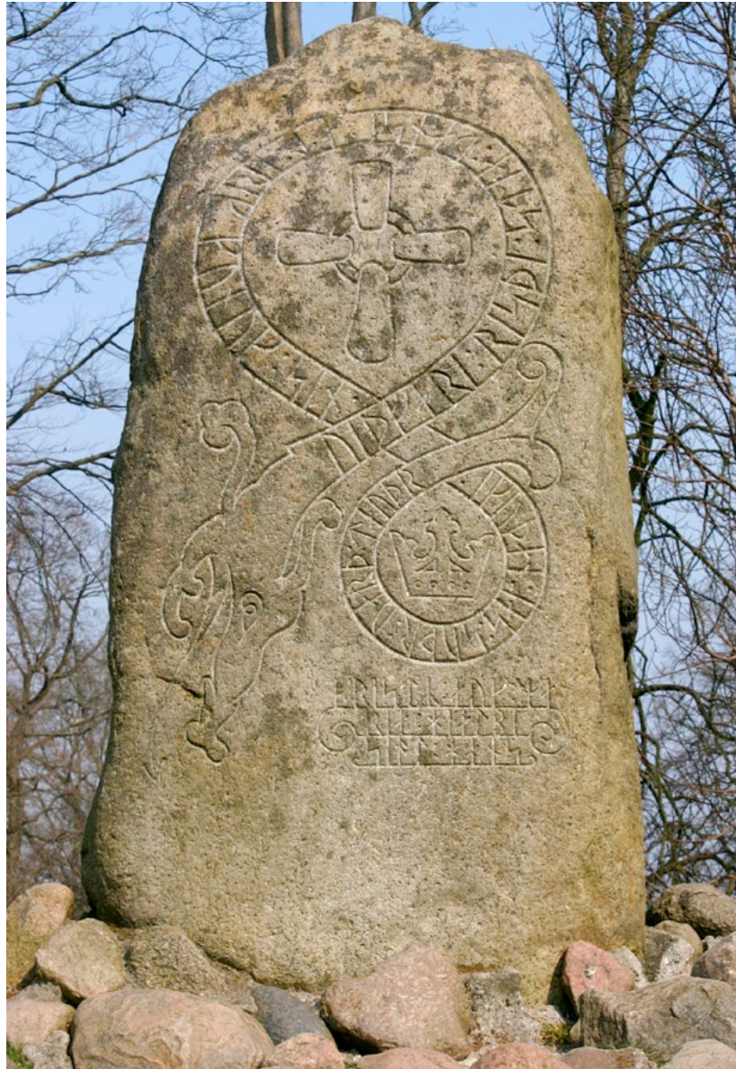
Minnessten över Kung Erik Ejegods, Borgvold, Viborg, Danmark. Texten lyder "Vidfare reiste liden sten, efter Erik Konning sin, Ejegod, der sydpå døde" - och under det står följande: "Fjernt fra sit kære Fædreland".