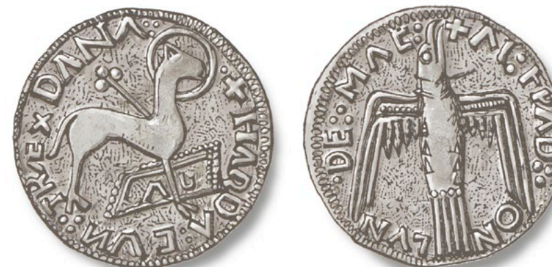
Hardeknud lät även prägla kristna motiv med Gudslammet och Heligeandesduvan.