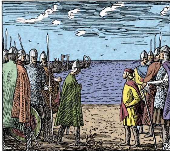
Mötet mellan Hardaknud och Magnus den gode - (H Egedius).

Vid Knud den Stores död i november 1035 hade redan den sjuttonåriga Hardeknud blivit insatt som sin fars ställföreträdare på tronen i Danmark. Det var också där han befann sig när han fick dödsbudet, engelsmännen valde genast Hardeknuds illegitima halvbror Harald Harefod till regent över England i Hardeknuds ställe. Samtidigt frigjorde nordmännen sig från det Danska herredömet och tillsatte den purunge Magnus som kung, Hardeknud fruktade därför även ett angrepp från Norge och vågade inte lämna Danmark.