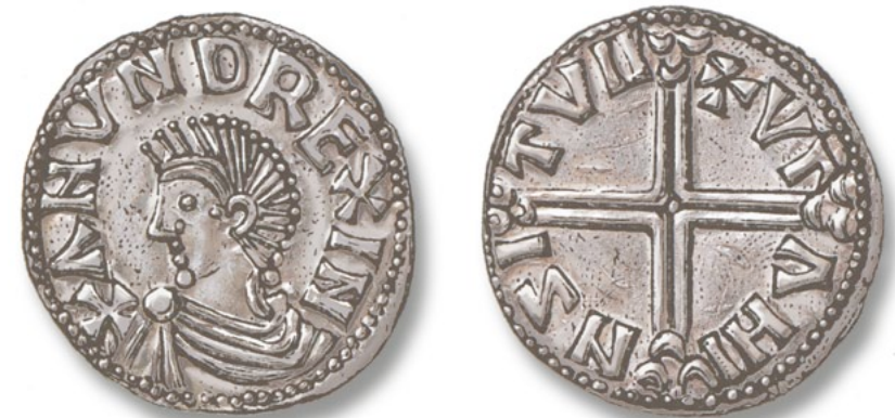
Mynt präglat av Anund Jakob Jonsson

Hans efterföljare Anund Jacob (1022-1050) präglade endast två olika mynttyper: