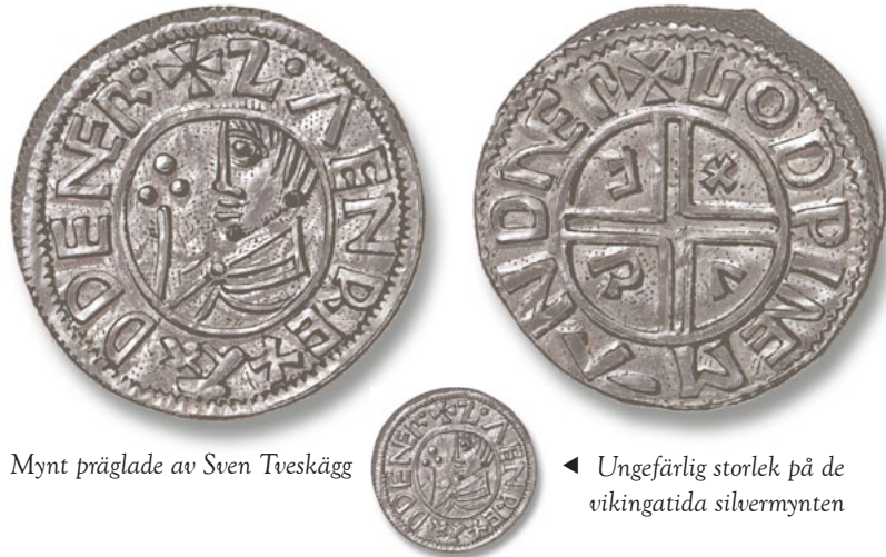
Mynt präglade av Sven Tveskägg