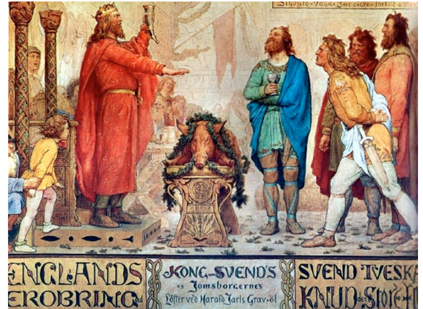
Sven Tveskägg och jomsvikingerne på Harald Blåtands begravning. Av Lorenz Frølich