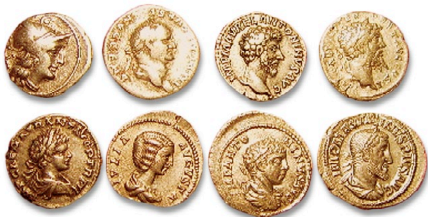
Första raden 157 f.Kr. Romerska republiken, 73 Vespasianus, c. 161 Marcus Aurelius, c. 194 Septimius Severus; Andra raden: 199 Caracalla, 200 Julia Domna, 219 Elagabalus, 236 Maximinus Thrax

Denarius (plural: denarer) är ett romerskt silvermynt som började präglas 211 f.Kr. och var ett av de vanligaste mynten i omlopp. Ordet "denarius" kommer från det latinska deni "tio gånger", eftersom dess värde (...?)