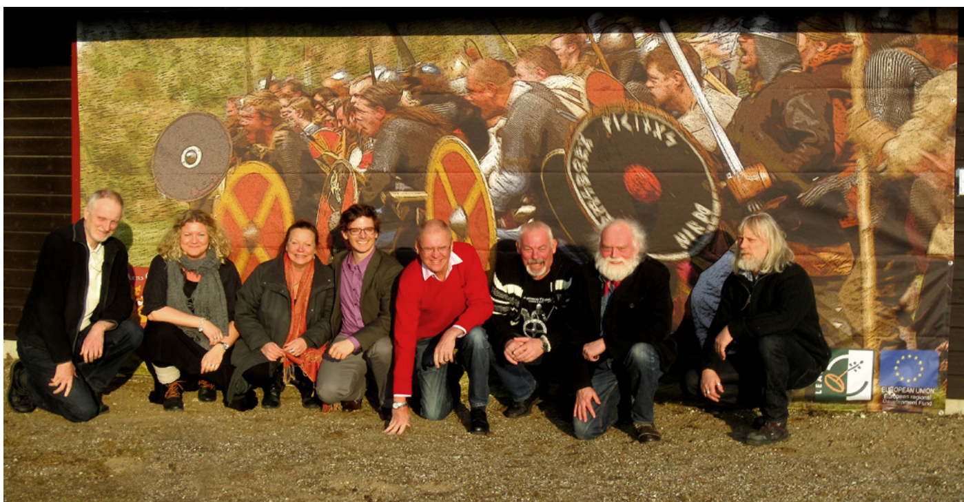
Möte på Fotevikens Museum med representanter från de museer som i sommar kommer att väcka liv i vikingen i Öresundsregionen.