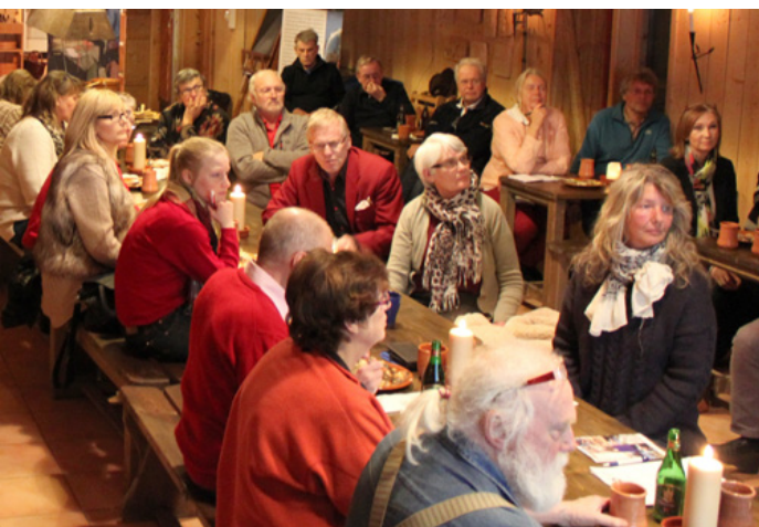
Mötet på Fotevikens museum var avstampen för en Vikingsatsning på Söderslätt med många lokala intressenter.

Tillsammans med ett antal intressenter försöker bl.a. Fotevikens Museum nu få till stånd ett slagkraftigt nätverk som kan utveckla konceptet "Vikings kommer" till något mycket attraktivt för både boende i regionen såväl som för den internationella publiken.