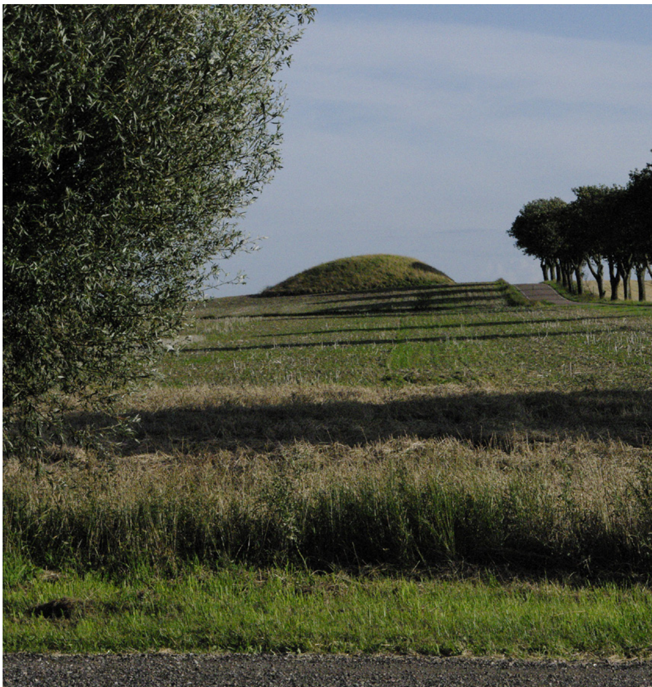
Platsen för Skytts häraids vikingatida och tidigmedeltida ting låg troligtvis här, invid landsvägen strax norr om Hammarlövs kyrka norr om Trelleborg. Den gamla bronsåldershögen bär fortfarande namnet ”Tingshögen”.

”På den bestämda dagen efter primsången bar kungens moder järn och det försiggick på det bästa sätt. Närvarande var kungen och ärkebiskopen och andra