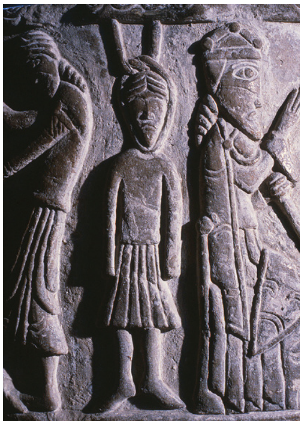
En genom hängning avrättad man. Scen från Löderups dopfunt i Skåne från mitten av 1100-talet.

”Mister man näsa sin, då tage han fulla mansböter, så ock för tunga, så ock för bägge ögonen och för båda händer och för båda fötter. Mister man ett öga