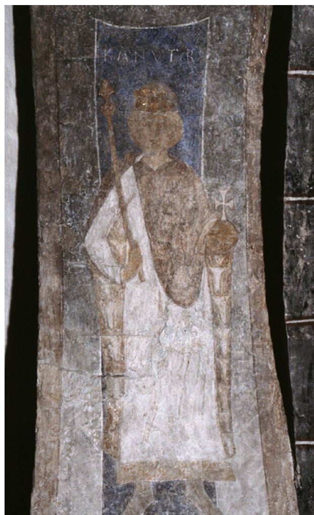
Kung Knut VI, död 1202. Samtida målning i Stehag kyrka i Skåne.

"Detta är Vederlagen, som Knut kung (Knut VI), Valdemars son och Absalon ärkebiskop lät skriva, som den var i gamle Knuts dagar. Gamle Knut (Knut den store) var kung i Danmark och England och Norge och Samland (norra Tyskland) och hade samlat en stor hird från alla länderna som han var kung över, och han kunde inte haft dem tillsammans i lugn och