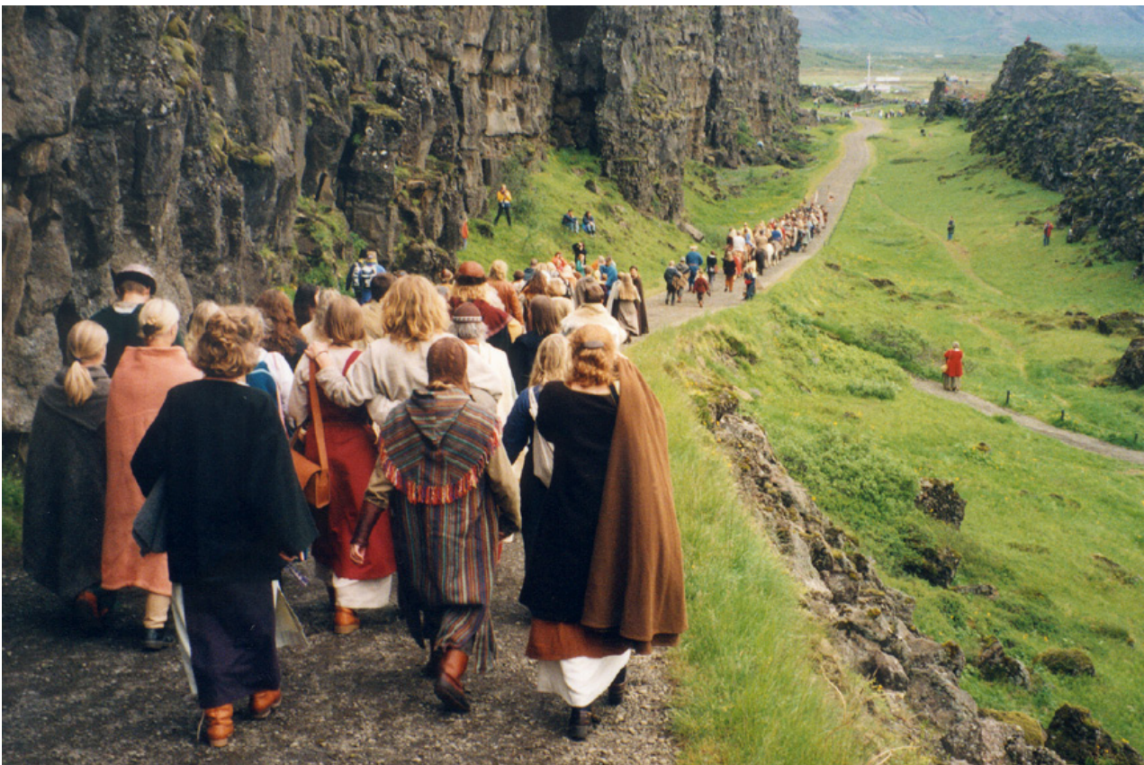
Tingvalla på Island var platsen för öns vikingatida Allting.