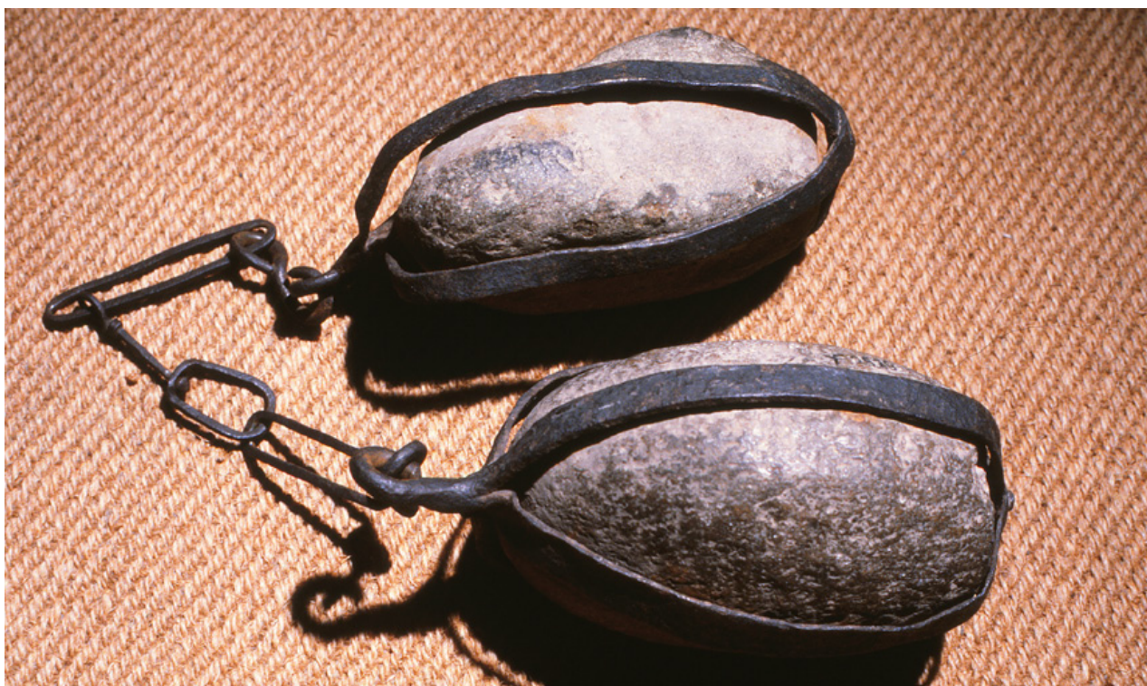
De s.k. ”Stadens stenar” användes för bestraffning av brottslingar. Stenarna hängdes runt halsen och sedan drevs den dömda ut ur staden. Stenarna på bilden användes under medeltiden i Ystad.

Denna händelse skedde i Norge i början av 1200-talet. Redan år 1216 hade emellertid ärkebiskopen Andreas Sunesen utfärdat en lag i Skåne som förbjöd järnbörd som bevis i rättsaker.