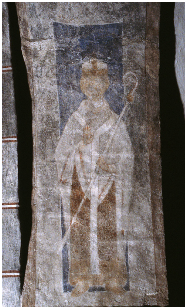
Ärkebiskop Absalon, död 1201. Samtida målning i Stehag kyrka i Skåne.

I Skånska lagen reglerades viktiga saker såsom frågor kring arv, bråk om jordegendomar, hur förfara vid dråp och människoskador, relationer mellan trälar och frigivna och om stölder men också frågor om hor och lönskaläger m.m. Totalt uppgår lagen till 224 paragrafer. Under rubriken ”Dråp” stiger det dåtida ättesamhället fram där blodshämnd har varit vanligt. Om någon slagit ihjäl en person kan mördaren tillsammans med medlemmar ur sin ätt vid landstinget