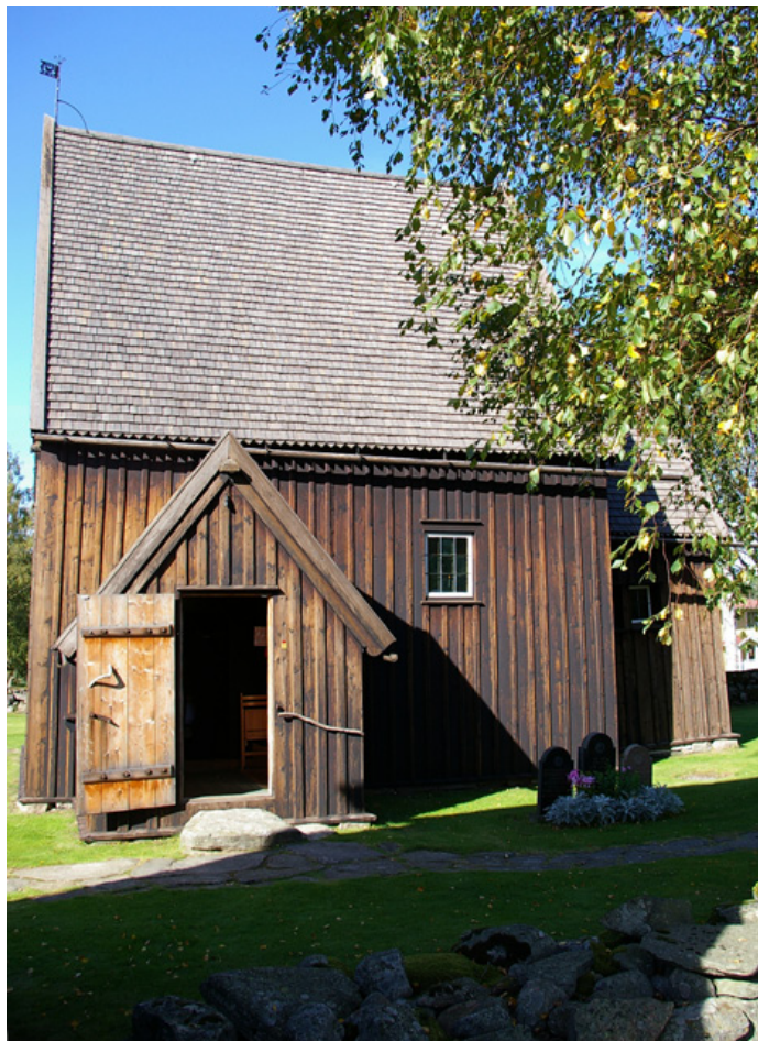
Hedareds stavkyrka i Västergötland är ett gott exempel på hur de äldsta träkyrkorna kan ha sett ut. Hedareds kyrka är dock uppförd först år 1508.

Det talas ofta om att kristendomens införande för kvinnans ställning innebar att hon gick från att vara en relativt fri kvinna till en mera underordnad varelse. Att kvinnan i den kristna läran spelade denna roll är oomtvistat. Däremot vet vi inte hur det varit tidigare. Det finns helt enkelt inget källmaterial som