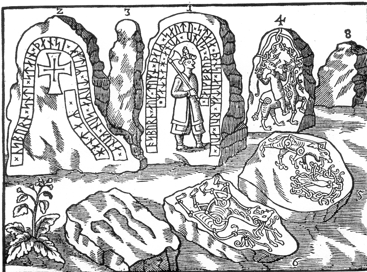
Ett av Skånes praktfullaste runstensmonument var Hunnestsadsmonumentet väster om Ystad. Tyvärr förstördes detta under 1700-talet och i dag finns endast ett fåtal stenar bevarade på Kulturen i Lund.

Honorius är ytterst degraderande mot kvinnorna. Han konstaterar att könsuppdelningen av en kyrkobyggnad har med styrka att göra. Männen i söder symboliserar de starkare i tron och får här den helige andes glöd så att de kan motstå världens frestelser och lidelser. Kvinnorna däremot är de svagare, de underordnade, eftersom de inte kan motstå frestelser och därför bör tygla köttets lustar genom äktenskapet som läkemedel. Kvinnorna bör också följa apostlarna Petrus och Paulus ord att de skulle vara beslöjade i kyrkan. Orsaken är att de är djävulens snara när de med utslaget hår snärjer ungdomens hjärtan. Genom slöjan kunde dessutom ingen kvinna genom sin frisyr drabbas av högmod inne i kyrkobyggnaden.