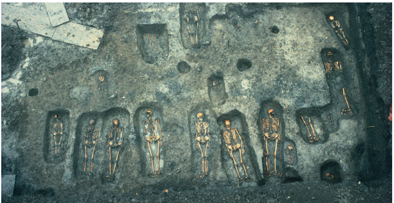
Utgrävning av den äldsta kristna kyrkogården i Tygelsjö söder om Malmö. De döda är orienterade på ett kristet sett, på rygg med huvudet i väster.

Snart började man alltså bygga kyrkor av sten. Stenbyggandet hade tidigare varit okänt i Norden – nu