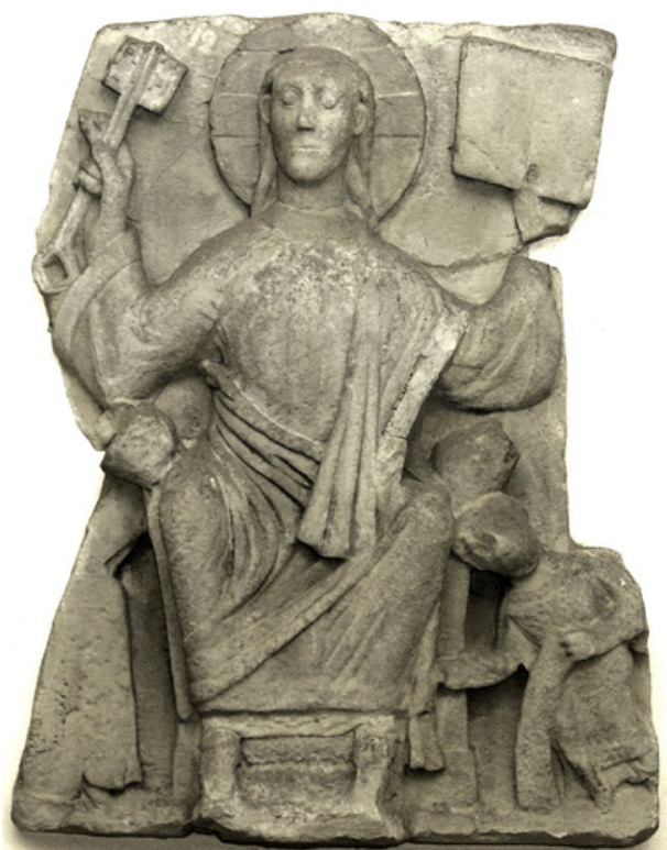
Kristusskulptur från 1050-talet i Bremen domkyrka.

I äldre kyrkohandlingar talas om hur stor asylen, dvs. kyrkogården, fick vara, mätt från själva kyrkobyggnaden. Man skiljde på större eller mindre kyrkor. Avstånden var för de förra 60 steg och för de senare 30. Med steg avsågs ”kyrkliga steg” vilka uppgått till ca