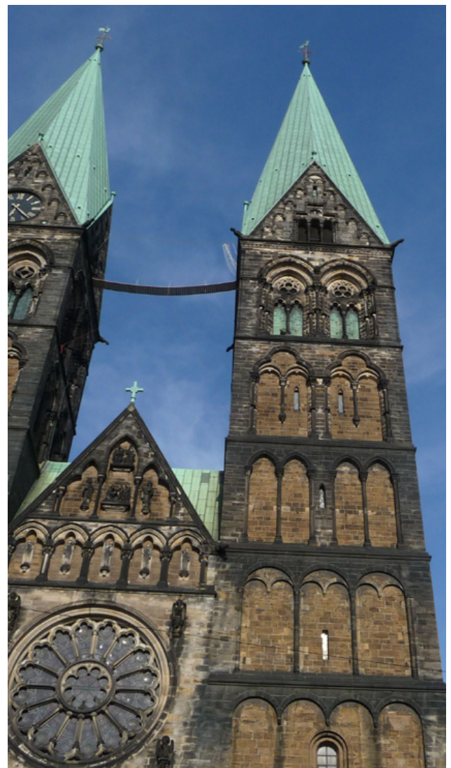
Bremens domkyrkas västfasad. Härifrån regerade mäktiga ärkebiskopar Norden.

Troligtvis har de tre gemensamt skisserat en plan för kyrkoorganisationen i norra Europa. Adalbert ville bli patriark över Norra Europa. Detta område skulle alltså lyda under Adalbert, inte under påven. För att lyckas instifta ett sådant patriarkat var det emellertid ett krav att under en patriark skulle finnas tio till tolv insatta lydbiskopar samt ett nytt, till kristendomen omvänt folk. I Tyskland låg endast två biskopsdömen under ärkestiftet i Bremen. Det gällde följaktligen att