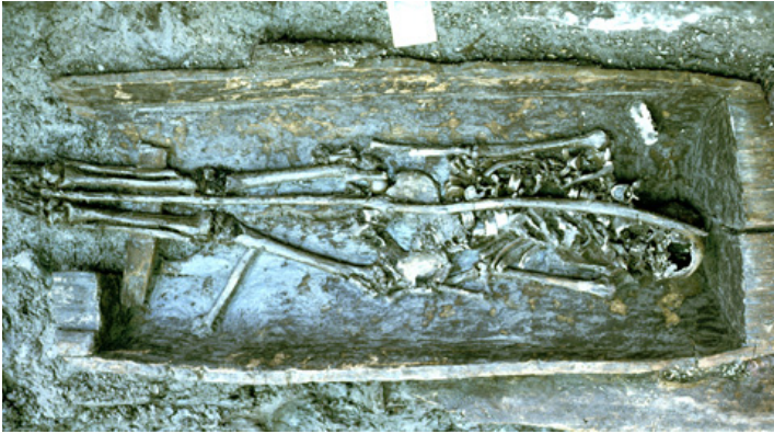
En trækista från det äldsta Lund, tillverkad av en urholkad ekstock.

1,5 meter. Detta är fasligt stora steg. Om man mätt ut avståndet genom just stegning måste man närmast hoppat längdhopp över den blivande kyrkogården. Kyrkogårdarna har redan i gammal tid upptagit stora ytor.