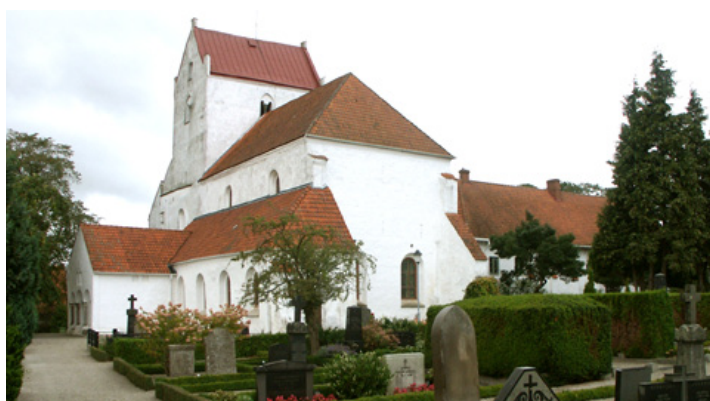
Dalby kyrka strax öster om Lund är nuvarande Sveriges äldsta bevarade stenkyrka.

För att övertyga påven behövdes en skriftlig redogörelse över situationen i norra Europa. Här kommer Adam av Bremens omfattande manuskript in i bilden. Adam har varit utsänd av ärkebiskop Adalbert till kung Sven Estridsen för att av denne, ärkebisko-