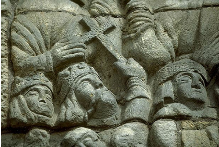
Kungamakten gick hand i hand med kyrkan. Här ses valdemar Sejer mottaga korset inför ett korståg i början av 1200-talet. Domkyrkan i Ribe.

de nämligen kampen att motverka allt som hotade Hamburg/Bremens kyrkliga maktställning i Norden. I Adams lista över Skånes biskopar finns således inte Godebald med. Den äldsta biskopslängden skulle, enligt Adams egna ord, i stället ha sett ut så här: ”Den förste Bernhard, den andre Henrik och även Eginö.” I Lunds domkyrkas dödsbok, det s.k. Necrologium Lundense från 1100-talet, möter vi emellertid nog en mera sanningsenlig version. Här står nämligen att engelsmannen Godebald var den förste biskopen i Lund.