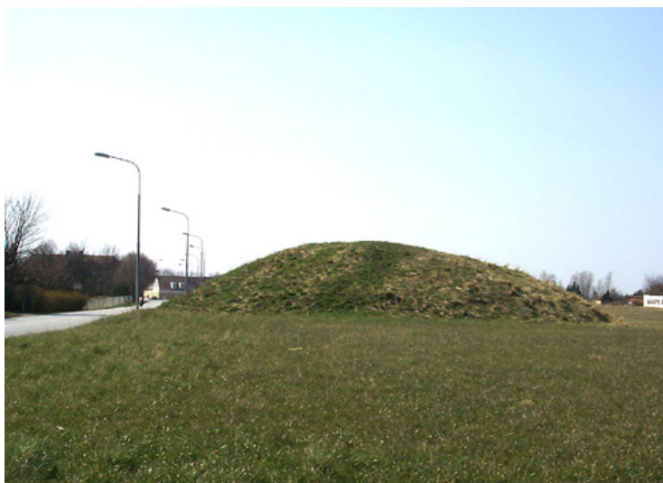
Kungshögen vid Höllviken sägs enligt legenden rymma den stupade prinsen Magnus kropp. Högen är dock från bronsåldern, ca 1200 f.Kr. Detta kunde riksantikvarien Oscar Montelius konstatera då han grävde ut högen på 1890-talet. Prins Magnus har givitvis, eftersom han var kristen, begravts i en kyrka, kanske i kyrkan i Lilla Hammar eller i Stora Hammar.

1134 säkrade Erik Emune och ärkebiskop Ascer Lund och Skåne som Nordens kyrkliga centrum. Kung Niels blev bara några månader efter slaget mördad i Slesvig och Erik Emune blev ensam kung över hela Danmark.