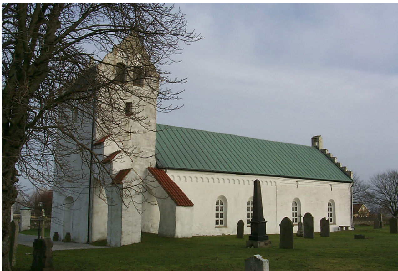
Stora Hammars medeltida kyrka uppfördes av den anonyme Oxiemästaren på 1150-talet. Han står bakom uppförandet av flera av Söderslättis medeltidskyrkor.

Knut Lavards yngre bror Erik Emune blev inte glad när han fick reda på att de gjort köttfärs av brodern – uppenbart välhackat kött skulle man våga tillägga efter den samtida berättelsen att döma. Erik grep nu till vapen och fick skåningarna med sig, även ärkebiskop Ascer i Lund. Den tyske ärkebiskopen i Bremen hade nämligen krävt av den tyske kejsaren att Norden åter skulle läggas under Bremen. För att vinna – eller snarare köpa – kejsarens gunst, godkände kung Niels detta. Påsken 1134 var Niels son Magnus, mördaren, hos tyske kejsaren i Halberstadt ca fyrtio mil ner i Tyskland. Magnus trädde fram och hyllade kejsaren som sin herre och i gengäld mottog han ur kejsarens hand Danmarks krona. Med kronan på huvudet och draget svärd gick han sedan före kejsaren i den högtidliga processionen. Han hade nu sålt sitt land och sin ärkebiskop i Lund för egen vinnings skull.