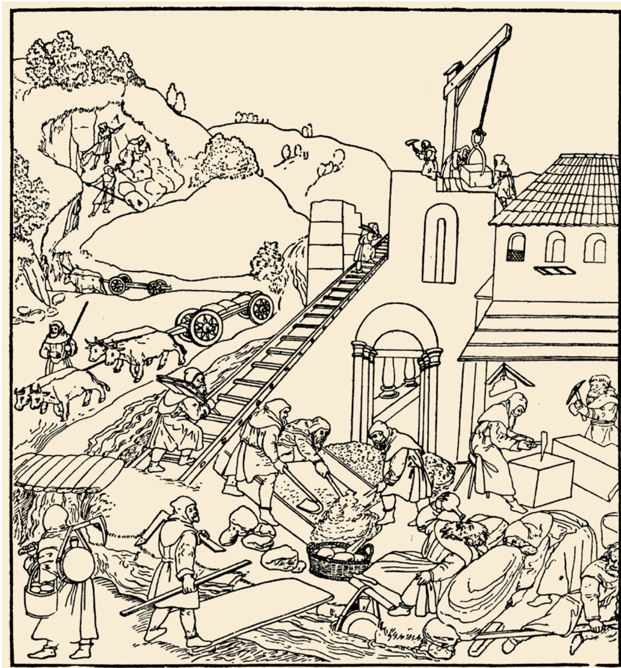
Stenkyrkobyggande under medeltiden. Detta gamla stick återger ett flertal arbetsmoment under själva byggprocessen.

Erik Emune motsatte sig däremot på det bestämdaste vänskapen med kejsaren. För ärkebiskop Ascer var därför valet lätt. Om han inte anslöt sig till upprorsmannen Erik Emune blev han avsatt som ärkebiskop - och han hade inte några fallskärmsavtal att ta till.