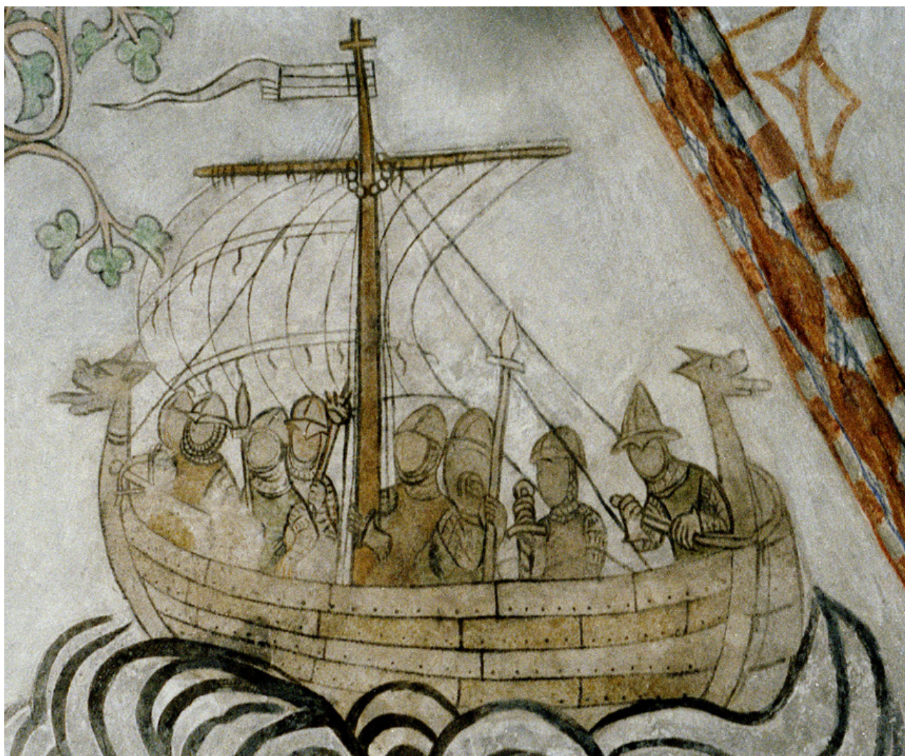
Denna medeltida kalkmålning återger ett krigsskepp, kanske liknande de som användes vid attacken mot Halör marknad sommaren 1134.