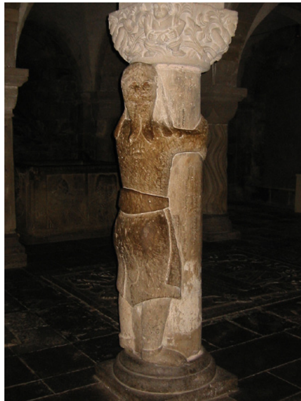
Jätten Finn i Lunds domkyrkas krypta är från 1000-talet. Den har troligtvis stått på annan plats före kryptans tillkomst.