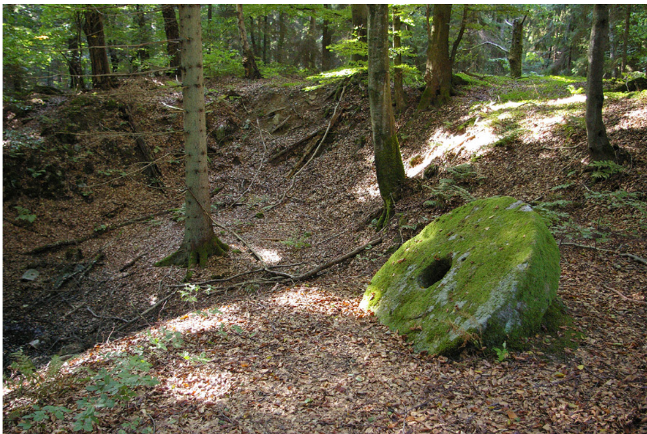
Stenskogen direkt sydväst om Höör mitt i Skåne var den plats där man under den tidiga medeltiden bröt sten till mängder av skånska kyrkor. I senare tid övergick arbetet på platsen till att tillverka kvarnstenar

mat och dryck att han dött i sina egna spyor. Biskop Eginus från Dalby hade fått ta över. Eginus har med stor sannolikhet genast gått igång med att bygga den första stenkyrkan i Lund. Varför skulle han inte ha gjort det – han hade ju på 1060-talet lagt grunden till en stenkyrka i Dalby.