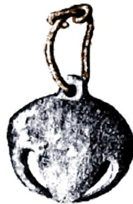
Bjällra från vikingatiden

Strängarna spelades direkt med fingrarna. Rekonstruktioner har gjorts, bl.a. av lönn. Lyran tycks i stort sett ha varit diatoniskt stämd men det kan ha förekommit många stämningssvarianter. Man kan utöka tonförrådet från de sex första tonerna i skalan till ungefär tre oktaver genom att man alstrar s.k. övertoner. Lyran erbjuder fler spelmöjligheter.