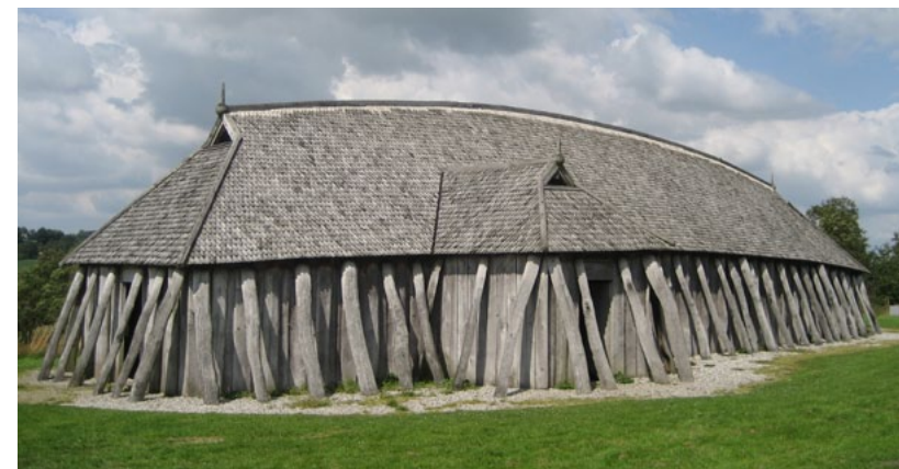
Gudme-fyrstens hal bör ha liknat vikingahallen på bilden, vilken finns i Fyrkat rekonstruerade vikingaby, nära Hobro i nordjylland.

Detta var en viktig handelsplats. Av hemmaproduktionen märks praktföremål så som en liten mask av silver för män och en silverhalsring med guldbeslag. Detta är tecken på att järnålderns Dankirke hade en rik överklass som hade råd med lyxvaror. Även stora mängder glasskärvor från folkvandringstiden 400-500 e.Kr. hittades här, de flesta dryckesbägare av grönt glas med pålagda trådar. Här återfinns också de första fynden av engelska sceattamynt från 600-700-talen.