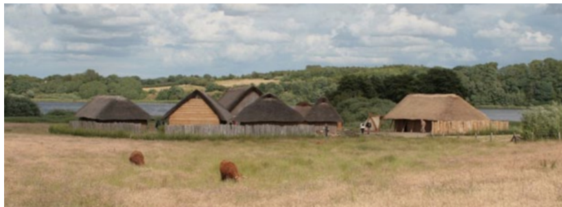
Rekonstruerade hus i Hedeby.

Hedeby låg mitt på Härvejen eller Oxvejen, den viktiga vägen nord-syd på Jylland som använts sedan bronsåldern.