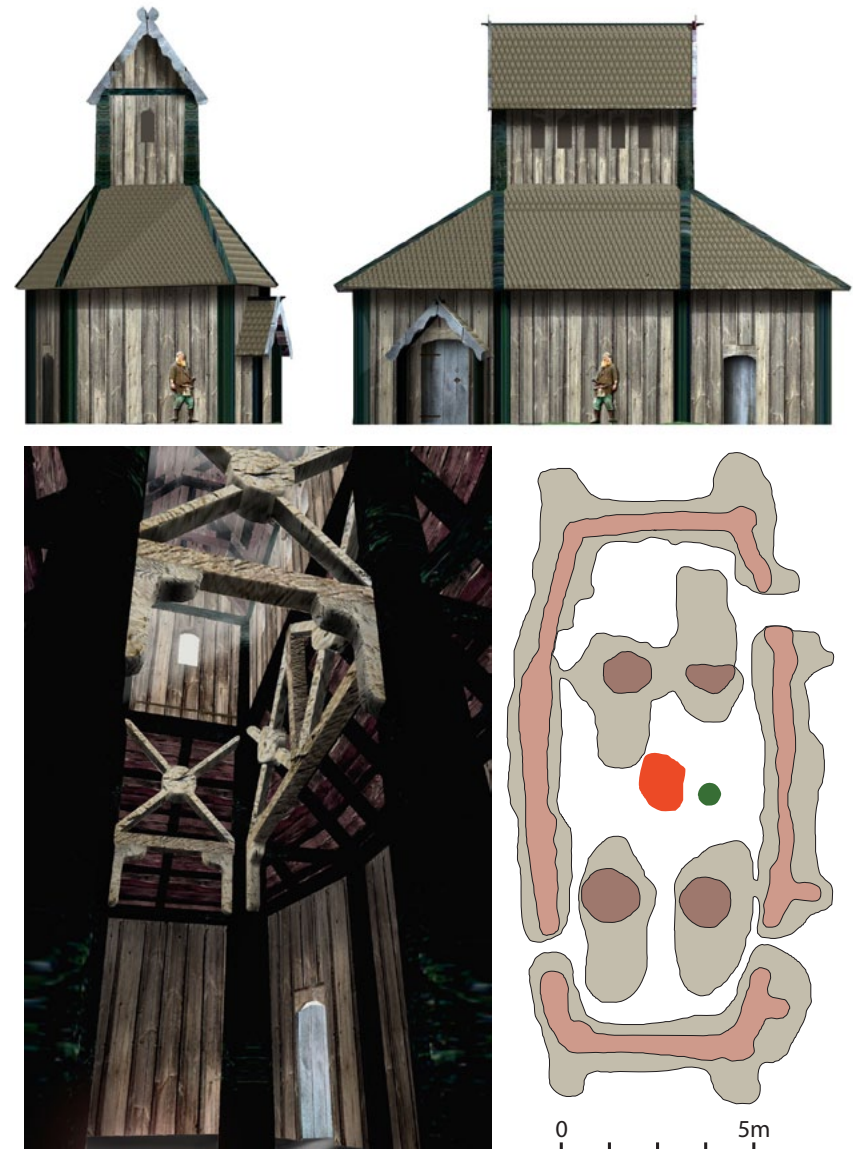
Templet i Uppåkra. Överst: exteriör efter Foteviksmodellen. Nedre till vänster: interiör efter Foteviksmodellen. Nere till höger: planen som bland annat visar härden (rött) och fyndplatsen för bägaren och glasskålen (grönt).

Man har även hittat en mängd förstörda spjut och lansspetsar som tydligen offrats.