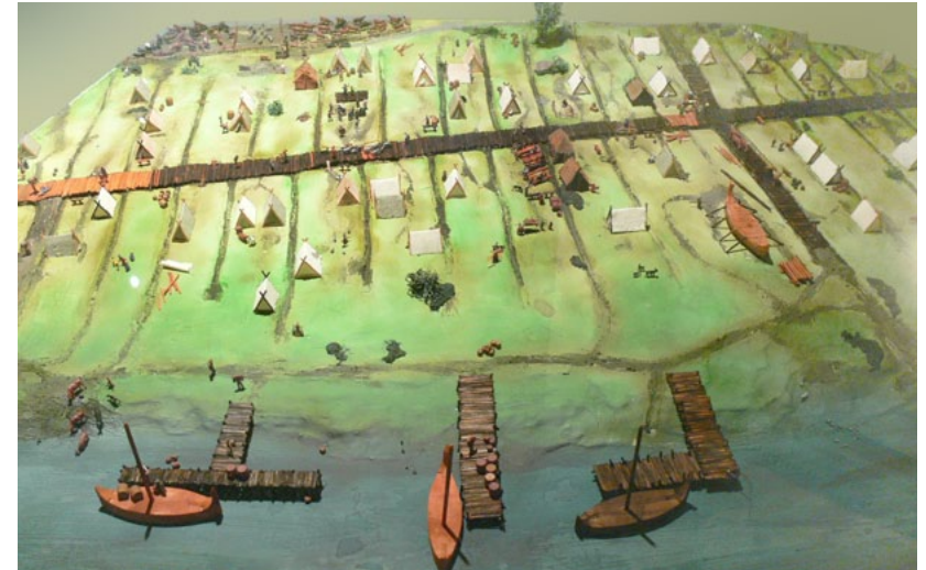
Modell av Ribe från tidig vikingatid. Ribe museum